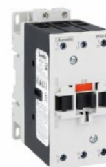
Stycznik mocy BF50